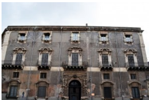
Palazzo Manganelli a Catania

Caltanissetta: apertura straordinaria, a cura della Delegazione FAI Caltanissetta , di Palazzo Moncada, con la visita dei saloni e del Museo Tripisciano e la rievocazione storica in abiti d'epoca della famiglia Moncada. Inoltre saranno visitabili l'atrio del palazzo, oggi occupato dalla sala cinematografica, di proprietà della famiglia Mandalà e la Mostra fotografica dell'associazione fotonauti; Tra le iniziative speciali, sabato 25 marzo, potranno essere ammirate, in Corso Vittorio Emanuele, le auto storiche messe a disposizione dai soci del Circolo Nisseno dell'Antico Pistone. E ancora, la Zolfara del Persico a San Cataldo dove, con l'aiuto di un cantastorie e di attori figuranti in abiti d'epoca, si potrà rivivere magicamente la storia delle miniere dei carusi e dei picconieri , grazie alla drammatizzazione di alcune scene della novella Pirandelliana " Ciaula scopre la Luna ".