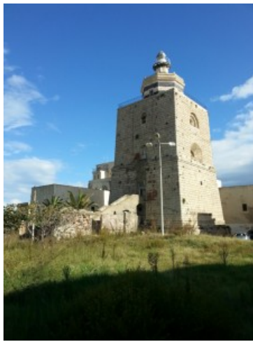
La "Lanterna" di Messina

Messina: la Lanterna del Montorsoli, edificio simbolo del ruolo strategico nel Mediterraneo della città di Messina nel XVI secolo, i suoi bastioni per la prima volta aperti al pubblico , il Bacino di carenaggio, normalmente chiuso al pubblico in quanto zona militare; e infine Villa Caronia, nota come "Casa Rossa" a Giardini Naxos , situata in uno dei punti panoramici più belli di Taormina e infine il seicentesco Palazzo Larcana Russo a Capizzi con gli ultimi restauri del piano nobile normalmente chiusi al pubblico;