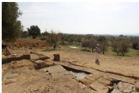
Scavi del Teatro Ellenistico ad Agrigento

Ogni località avrà le sue sorprese e anche quest’anno il catalogo delle aperture è molto vario e ricco di proposte sorprendenti. Su “ www.giornatefai.it ” l’ elenco completo delle aperture , tra cui segnaliamo in Sicilia: