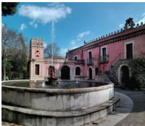
Villa Landolina a Siracusa

Ragusa: il Giardino del Tubercolosario e le Latomie di Cava Gonfalone a Ragusa in fase di recupero; l'area archeologica di Kaukana, chiusa da diversi anni e recentemente ripulita, e la Chiesa Madre, con il suo soffitto ligneo fresco di restauro, a Comiso ; Palazzo Bruno di Belmonte a Ispica , l'edificio liberty più importante della provincia di Ragusa; a Modica la Chiesa del Collegio, oggi Santa Maria del Soccorso, chiusa da oltre 20 anni per restauro ed eccezionalmente aperta per le Giornate FAI di Primavera ; Torre Cabrera a Pozzillo ; i Palazzi di Via Mormino Penna a Scicli e infine l'originale itinerario Sicilian Liberty attraverso le case e i palazzi di Vittoria risalenti ai primi anni del Novecento.