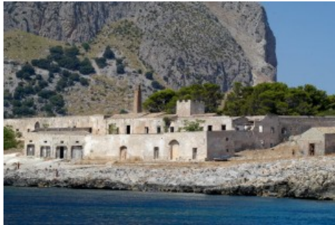
La Tonnara di San Vito a Trapani

Trapani: visita straordinaria alla parte esterna della Tonnara di San Vito Lo Capo , al settimo posto della classifica nazionale dei “ Luoghi del Cuore ”, il censimento organizzato dal Fondo Ambiente Italiano a cui hanno aderito in questa ottava edizione più di un milione e mezzo di italiani. La Tonnara è oggi un bene vincolato ma abbandonato e non è visitabile perché pericolante; il Giardino pantesco di Donnafugata sull’isola di Pantelleria ; la Chiesa di Santa Maria della Stella ad Alcamo , apertura straordinaria per la prima volta proprio in occasione delle Giornate FAI di Primavera; il Parco delle Cave a Marsala e l’Area Archeologica di Capo Beo.