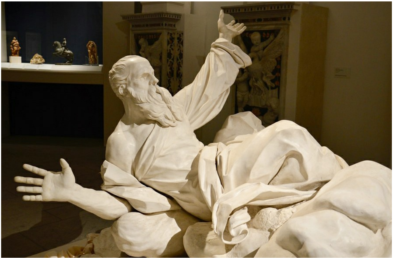
L'opera di Giacomo Serpotta all'Oratorio dei Bianchi