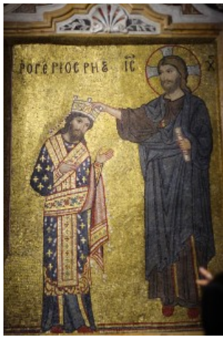
Ruggero II a la "Martorana"

Il percorso è ampio ed articolato. Su iniziativa e proposta dalla cantina Rallo , che a tale percorso ha dedicato due vini (Lazisa e Lacuba, ispirati ai Castelli della Zisa e de La Cuba) abbiamo visitato alcuni dei siti più significativi, con un occhio di riguardo alla componente enogastronomica. La Chiesa della Martorana, al secolo Santa Maria dell'Ammiraglio , fu costruita nel 1143 dall' Ammiraglio di Ruggero II di Altavilla, Giorgio di Antiochia . In stile Bizantino, sorse nei pressi di un monastero benedettino, fondato dalla nobildonna Eloisa Martorana . La storia narra che nel XVI secolo, durante la visita di Carlo V, le monache del monastero, volendo mostrare i frutti del rigoglioso agrumeto del complesso, ma essendo in luglio impossibile farlo, crearono dei dolci in pasta di mandorla che riproducevano arance, mandarini e quant'altro. Dolci che ancora oggi rappresentano un must della tradizione pasticceria palermitana e che ricordiamo con il nome di Frutta Martorana (per l'appunto). Prima tappa e prima commistione tra l'architettura, la storia e l'enogastronomia. La chiesa presenta il prototipo del Cristo Pantocratore , icona dei monumenti di culto più importanti del periodo, trait d'union tra Palermo, Monreale e Cefalù.