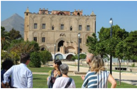
Il Castello della Zisa