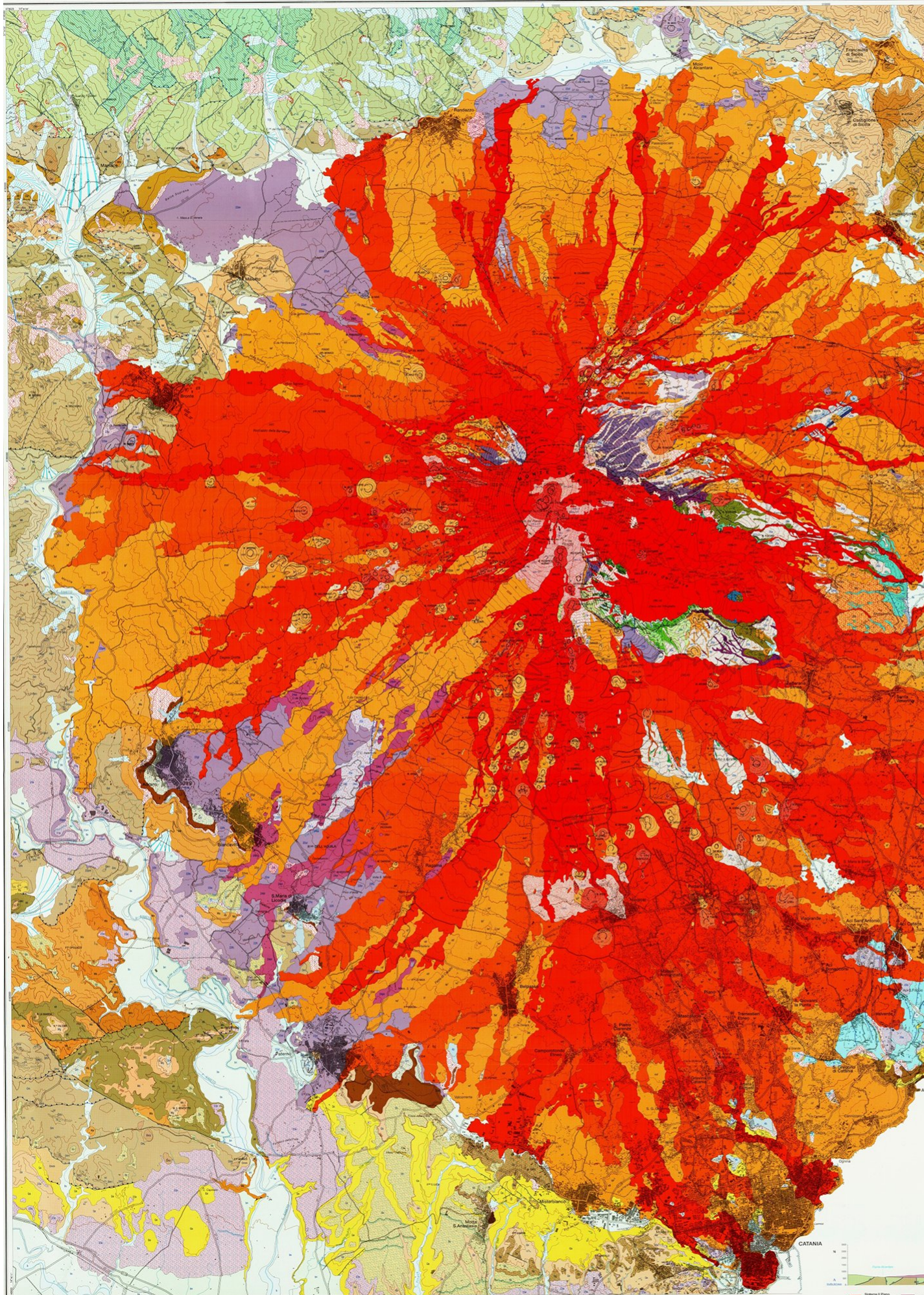
mappa geologica dell'Etna