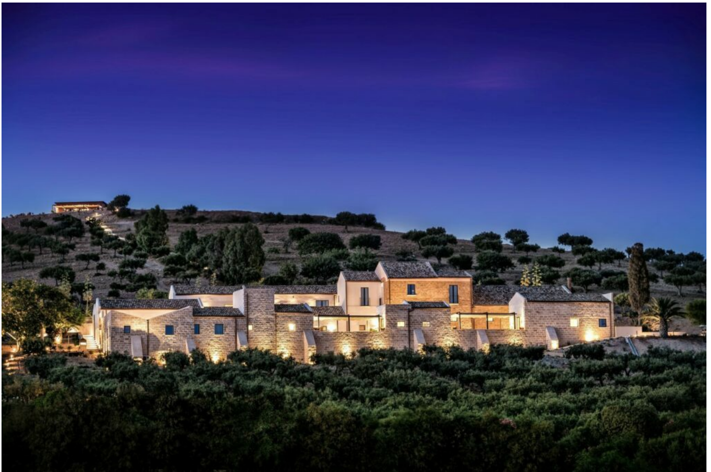
Firriato Calici di Stelle