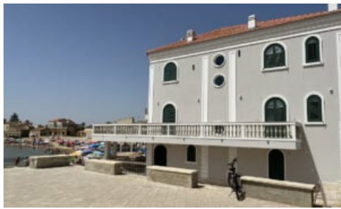
Punta Secca: la casa del commissario nella fiction

Il passaggio si trova nel racconto La Finestra sul Cortile di Andrea Camilleri . Conosciute ormai in tutto il mondo, le avventure del commissario Salvo Montalbano sono un assoluto di letteratura contemporanea, in uno stile non strettamente dialettale o riconducibile necessariamente all'agrigentino, piuttosto un italiano pregevole (ri)tradotto in siciliano con un "sound" universale e identitario.